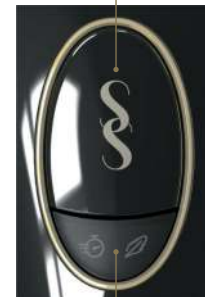
Nút chế độ