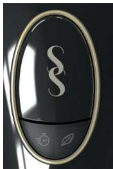
Chế độ Mạnh mẽ – Không có đèn chỉ báo

Bạn có thể sử dụng một trong ba chế độ sau của SMOOTHSKIN PURE trong quá trình điều trị: