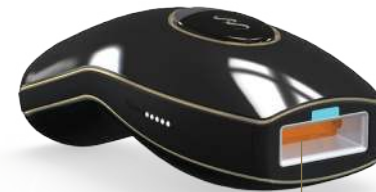
Bộ lọc thủy tinh

KHÔNG SỬ DỤNG nếu SMOOTHSKIN PURE trở nên rất nóng khi chạm vào. Điều này nghĩa là thiết bị có thể đã bị hỏng.