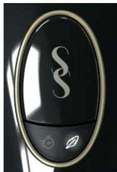
Chế độ Nhẹ nhàng – Đèn chỉ báo bật