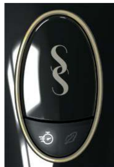
Chế độ Tốc độ – Đèn chỉ báo bật

Chế độ Mạnh mẽ (Power Mode) là chế độ cài đặt mức năng lượng cao nhất của thiết bị. Chế độ Mạnh mẽ sẽ mang lại kết quả tốt nhất, vì chế độ này sử dụng công suất tối đa có thể cho tông da đậm nhất của bạn. Chế độ này hoạt động đặc biệt hiệu quả trên các khu vực có lông cứng mà ở đó lông có xu hướng dày hơn, chẳng hạn như nách và đường bikini.